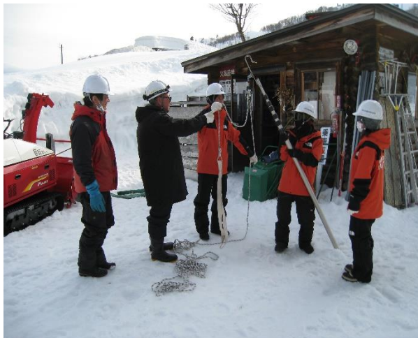
救助用具取扱い説明