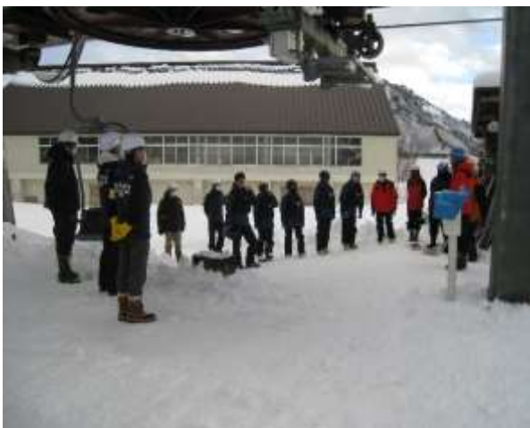
救助用具取扱い説明